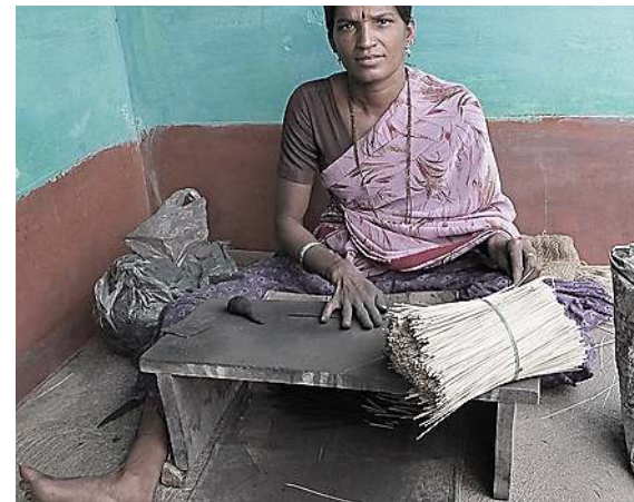
Vrouw die de hele dag met de hand wierook rolt met houtskool-poeder.

Rapport van vakbond over wierook rollen.