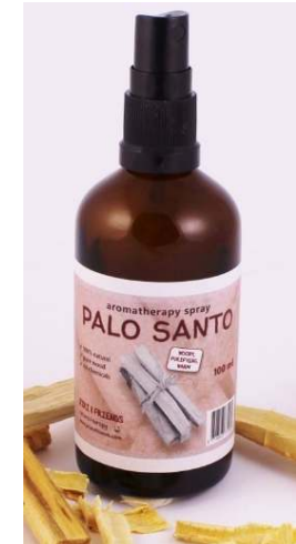
Palo Santo SPRAY