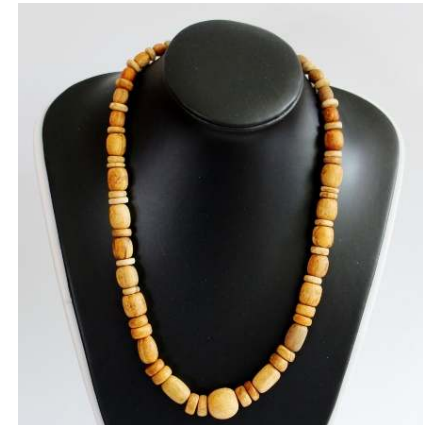
Palo Santo handgemaakte ketting