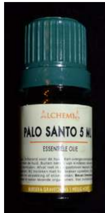
Palo Santo etherische olie