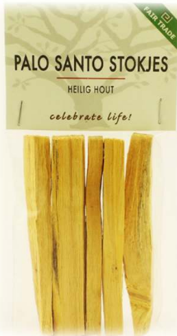
Palo Santo stokjes