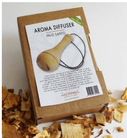
Palo Santo diffuser Voor in de auto